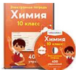
Электронная тетрадь по химии 10 класс...