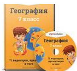
География 7 класс ФГОС