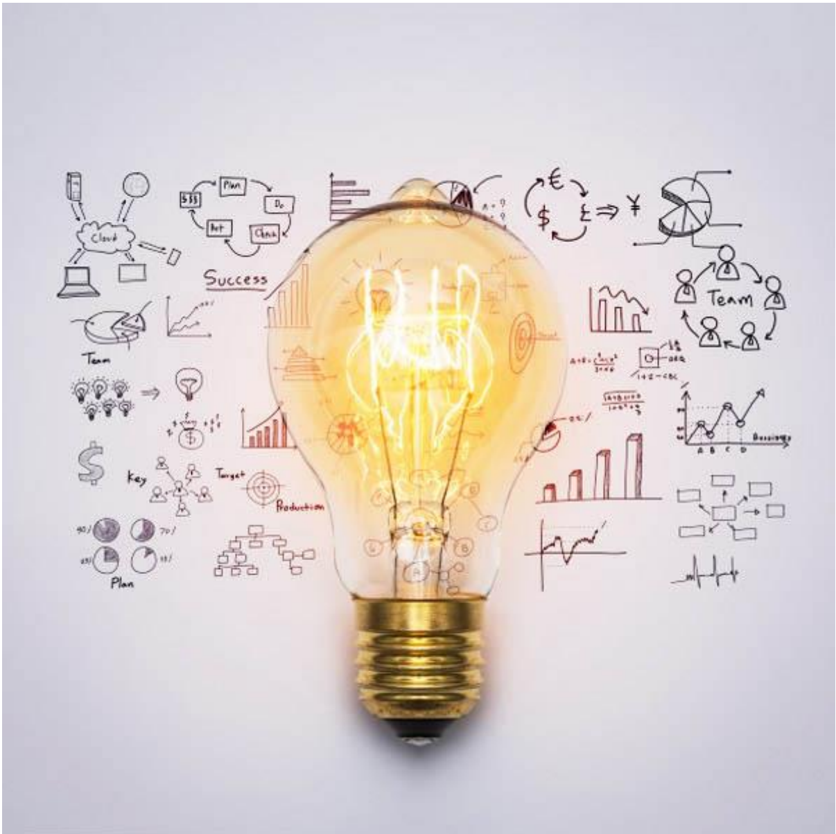
Система работы с высокомотивированными и одаренными учащимися по... 1200 руб. 4000 руб.