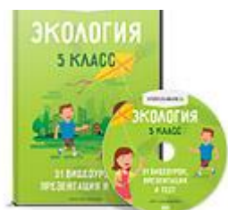
Экология 5 класс