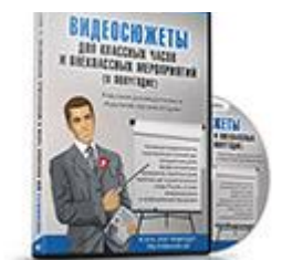
Видеосюжеты для классных часов и...