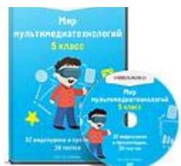
Мир мультимедиа технологий 5 класс