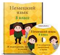
Немецкий язык 8 класс ФГОС